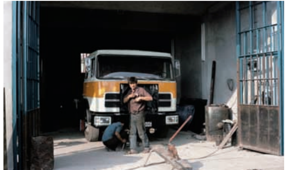
Hier ein FIAT 190 im fortgeschrittenen Stadium seiner Wiederauferstehung. Alles 'home made'. Here a FIAT 190 in advanced process, all home made.