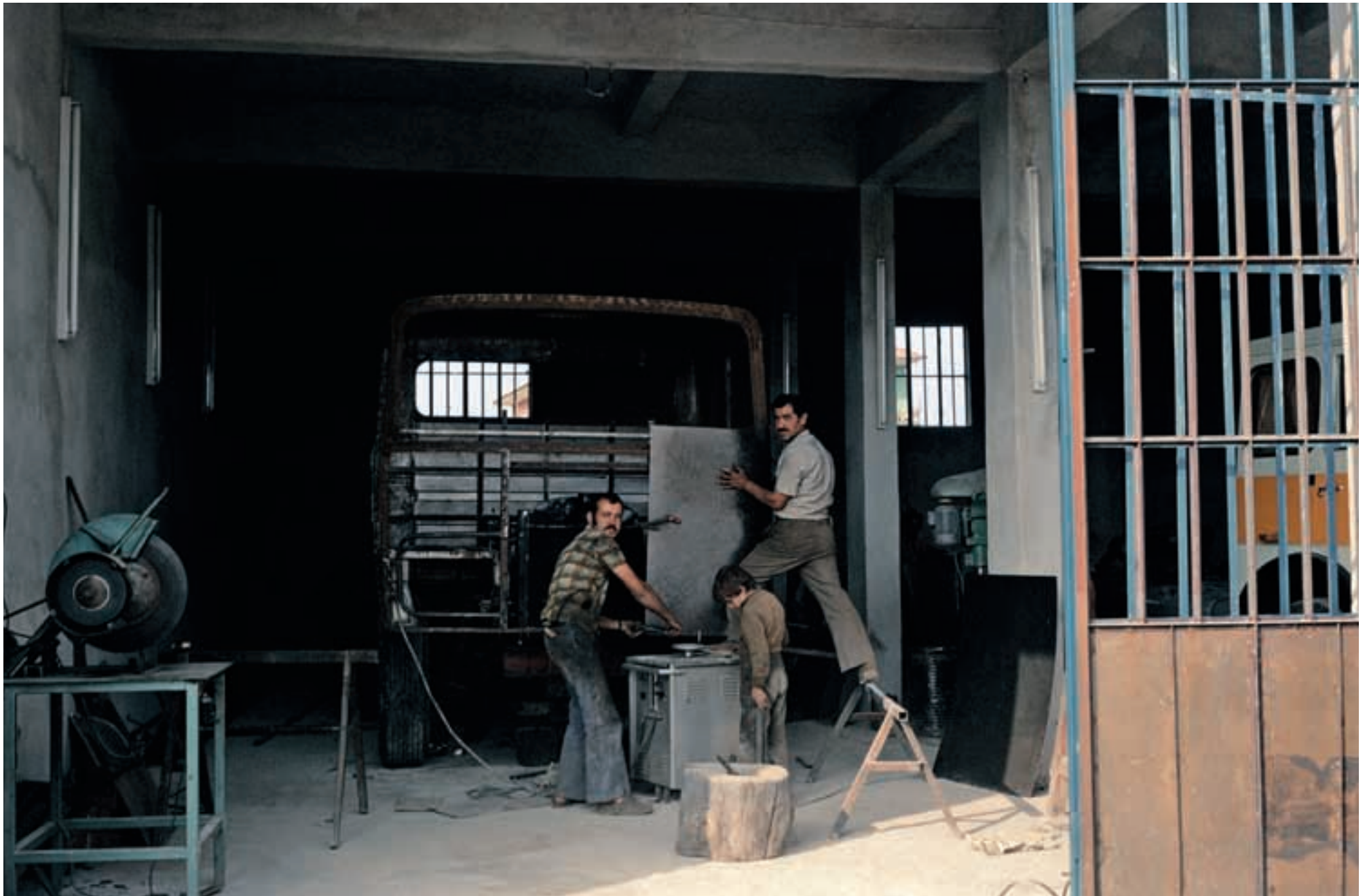
Das handwerkliche Geschick der Türken ist überwältigend. In einfachsten Werkstätten wurden ganze Fahrerhäuser neu angefertigt! The craftsmanship of the Turks is mind-blowing. On plain and simple workshops they build cabins looks like the original ones!