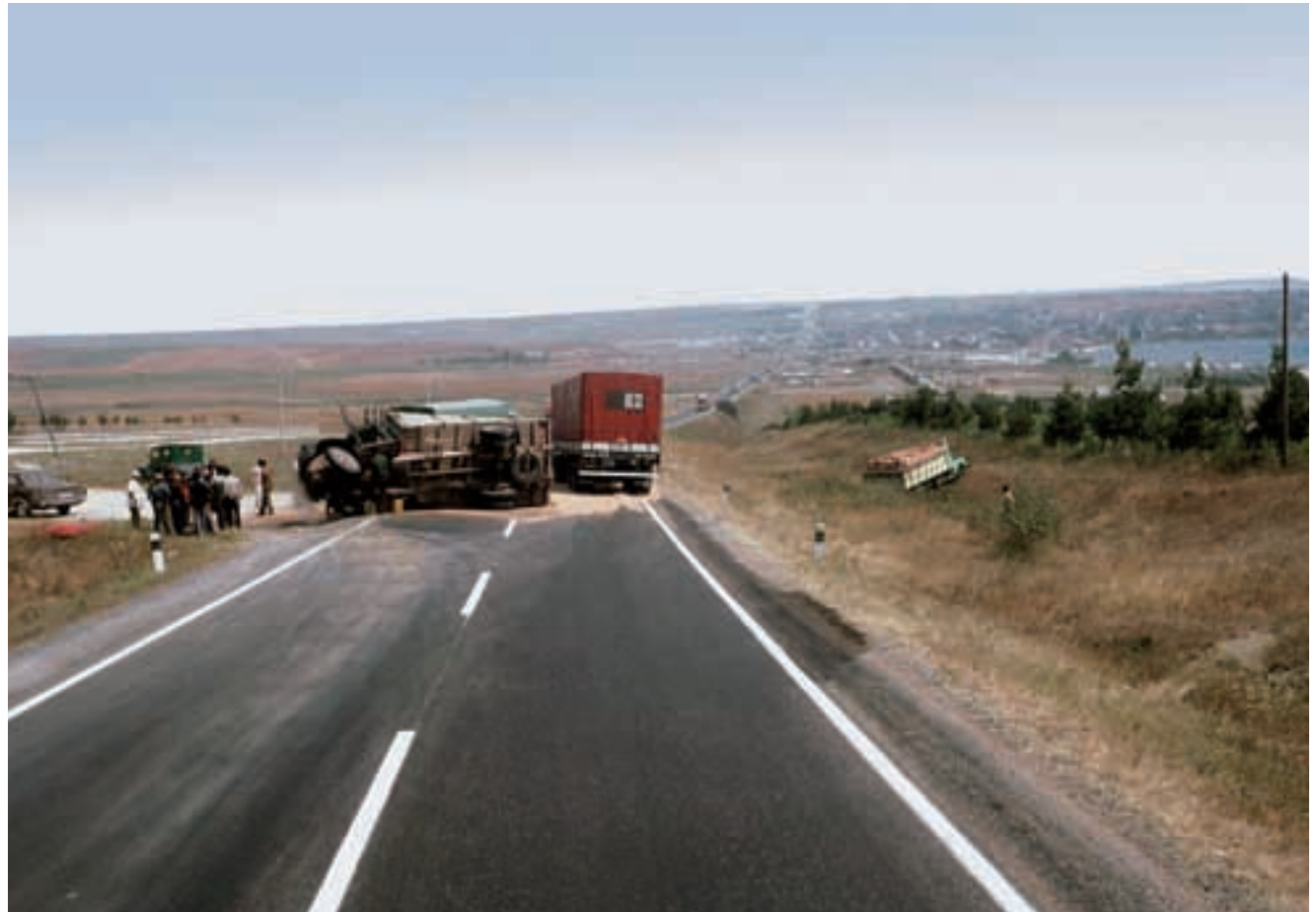
„Tonka“ wurden die türkischen Solo-LKW's genannt. Ihr Kamikaze-Fahrstil war legendär – die Crashes auch, wie hier kurz vor Edirne.

Der erholsamere, aber nicht minder anspruchsvolle Weg, führte über Griechenland, anstelle via Bulgarien. Die Grenzen waren nicht so überlastet, aber die Strecke oft schmal.