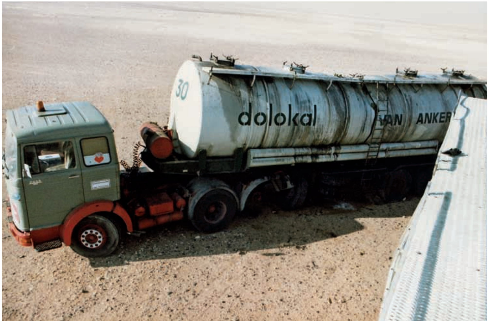
Hinterachsschaden am LPS2232 1981 in der Wüste zwischen Rutba und Bagdad. Trouble with the back-axle of the LPS 2232 out in the Iraqi desert, between Rutba and Baghdad.