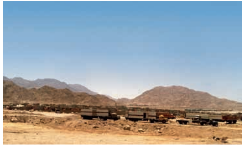
Export Rundhauber LS1924 oder 28 mit Kühlaufleger sind scheinbar nie einzeln anzutreffen. A couple off bonneted export-style Mercedes with reefers.