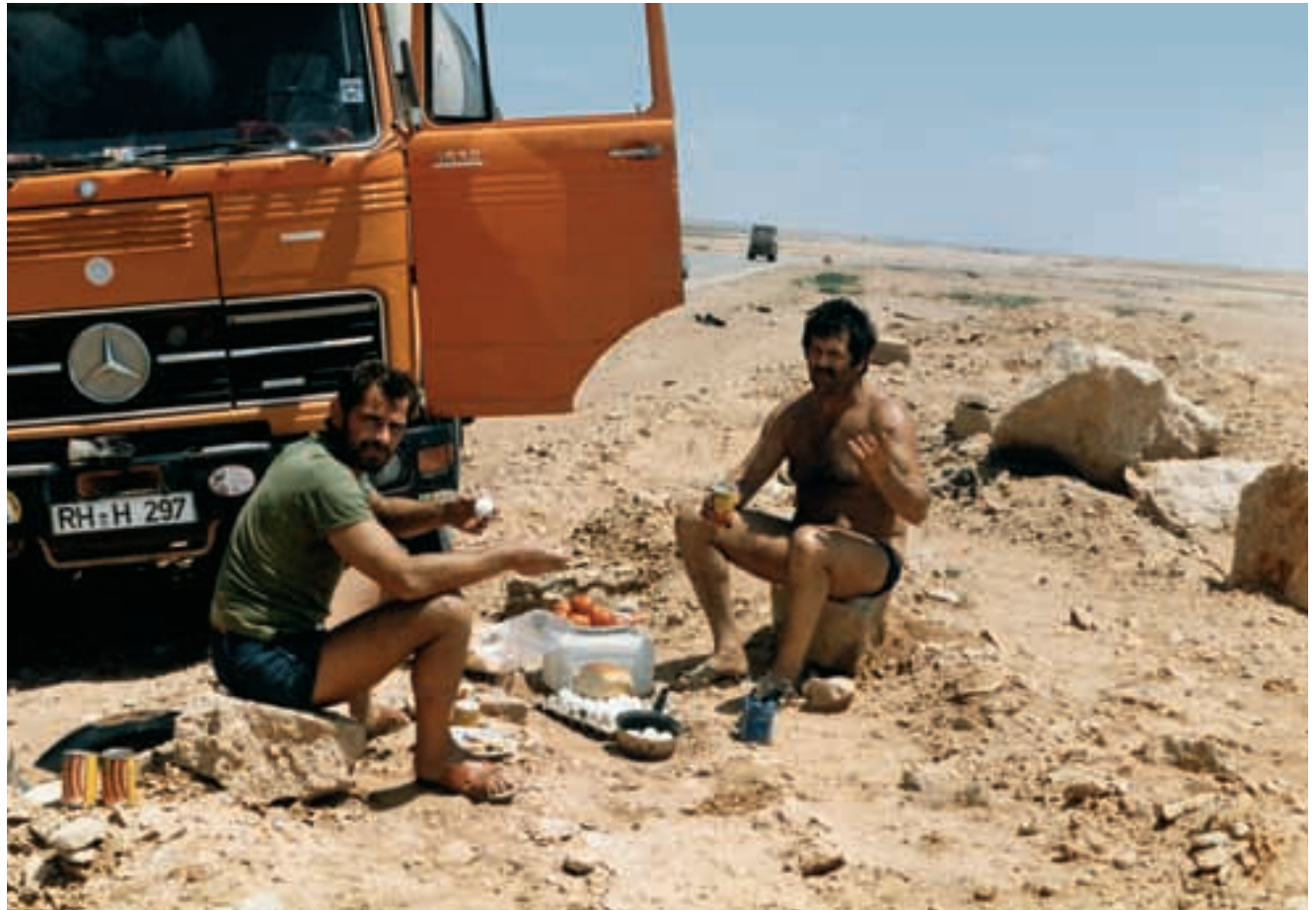
Mit leerem Magen geht nichts. Auch wenn ein Ventilschaft gebrochen ist, erst wird für's leibliche Wohl gesorgt.

And here we are, the "licensed garage". (below l.)