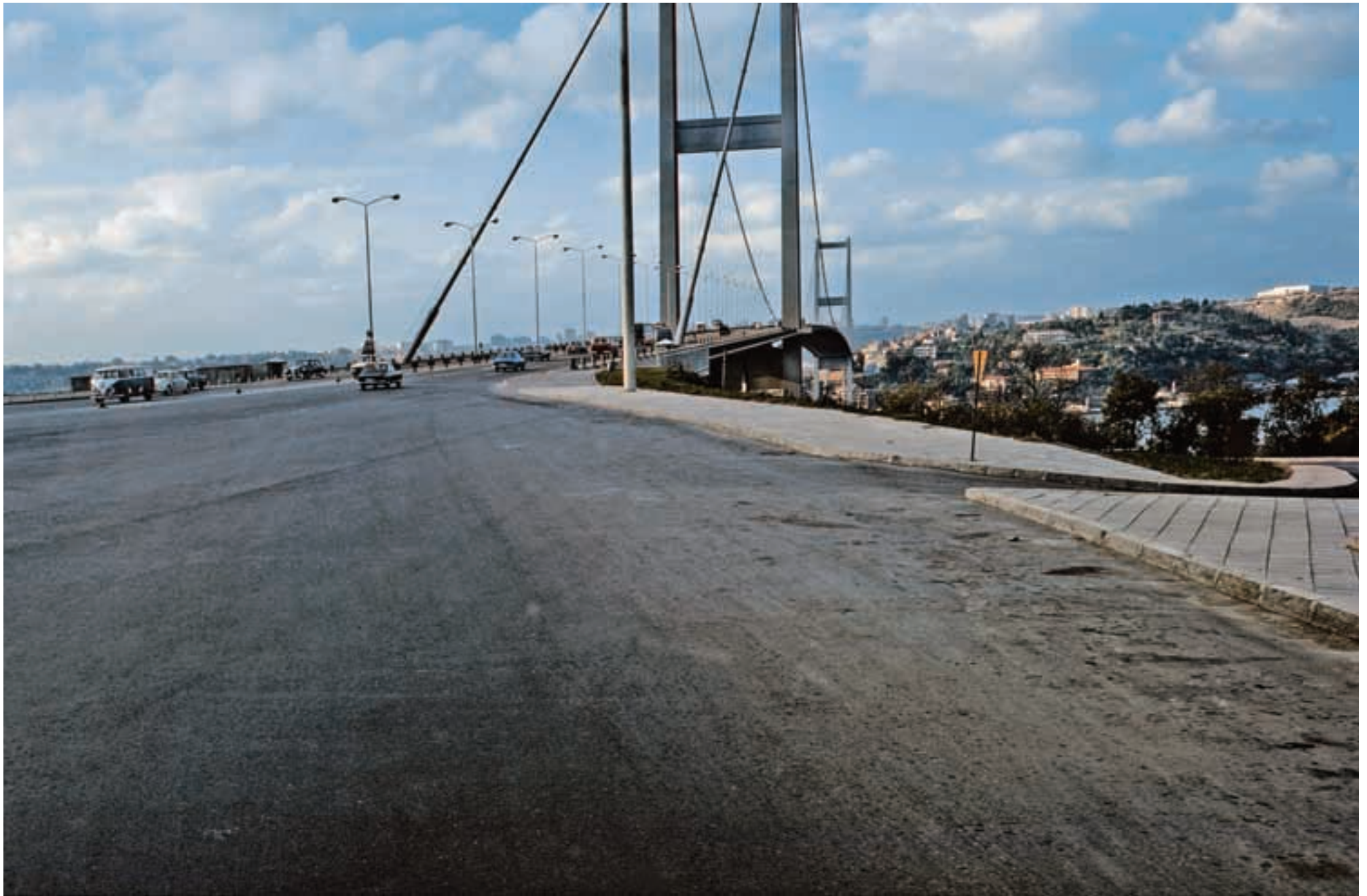
Die Bosphorusbrücke, das Tor zum asiatischen Teil der Türkei, wurde gerade rechtzeitig zum einsetzenden Boom des Orientverkehrs 1973 dem Verkehr übergeben. Die alten Fährschiffe blieben vorerst in Betrieb. The Bosphorus-Bridge, the door to the Orient, was just finished when the Middle East boom started in 1973. The old ferries where still used too.