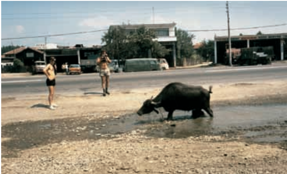
Ein Büffel beim Baden entlang des Weges. A buffalo while bathing along the road.