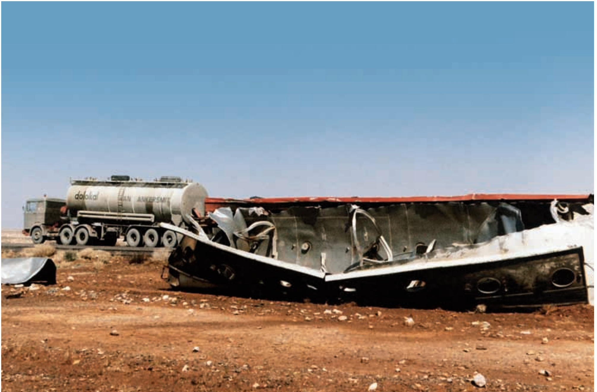
Ein missbrauchter Siloaufleger ist zerborstet. Diese Art von Tanks wurde auch zum Transport von Diesel genutzt. Sie sind zwar wie Flüssigtanks aus Aluminium gefertigt, aber die Deckel sind bspw. nur am Rand stumpf zusammengeschweißt. Das ununterbrochene Schwappen in den Tanks ohne Schwallbleche konnte gefährlich werden und belastete die Schweißnähte extrem. An encroached powder-tanker exploded. This kind of tankers were also used to haul diesel. They are built like liquid- tankers also from aluminium. But for example the front- and backend-lids were only welded together edge by edge. Compared with tankers those are welded interleave. The uninterrupted rocked without any baffles in the tank is very dangerous.