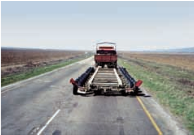
Culemeyer Straßenroller auf dem mörderischen Autoput.

Culemeyer Train-Wagon-Carrier on the gruelling Autoput across Yugoslavia. (top l.)