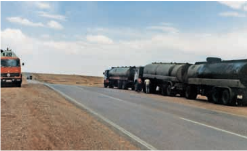
Roadtrain in Jordanien. 70-80.000 Liter Diesel. A Jordan style road-train, carrying 70-80.000 litres of diesel.